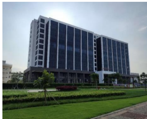
珠海高新区-中电科技园