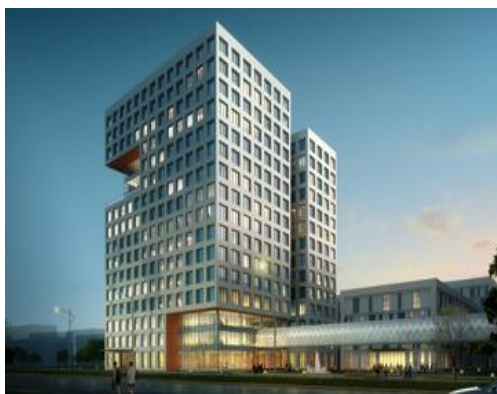
苏州园区-中科院纳米所