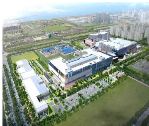
南通开发区医药健康产业园