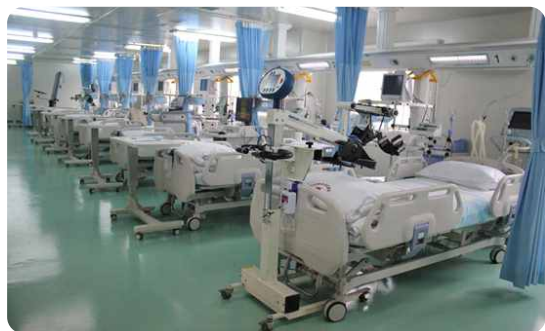
重症康复 (RICU) 病房