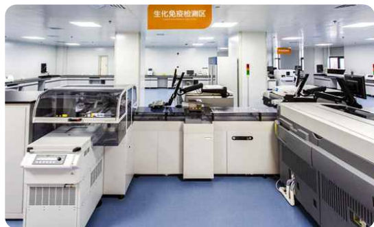
先进的全自动生化免疫检测流水线