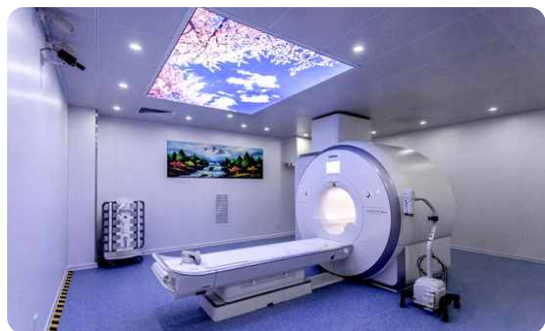
3.0T医用磁共振成像设备 Sempria