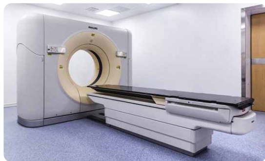
Brilliance CT Big Bore X射线计算机体层摄影设备